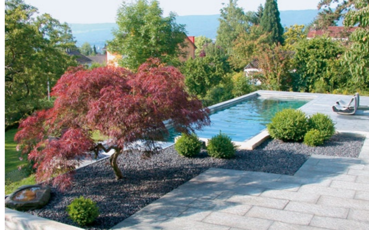
Neben Wasser spielen Sonne und Schatten eine grosse Rolle in einem Feng-Shui-Garten. Sonne bedeutet Aktivität, Schatten Ruhe.

Ja. Und auf die Geborgenheit. Viele mit einem zu offenen Garten wissen oft nicht,