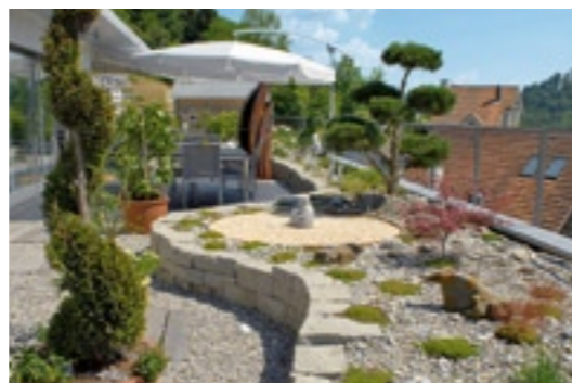
Geschwungene Linien wie bei dieser Natursteinmauer sorgen für einen harmonischen Energiefluss.

www.railaway.ch/messen und www.giardina.ch